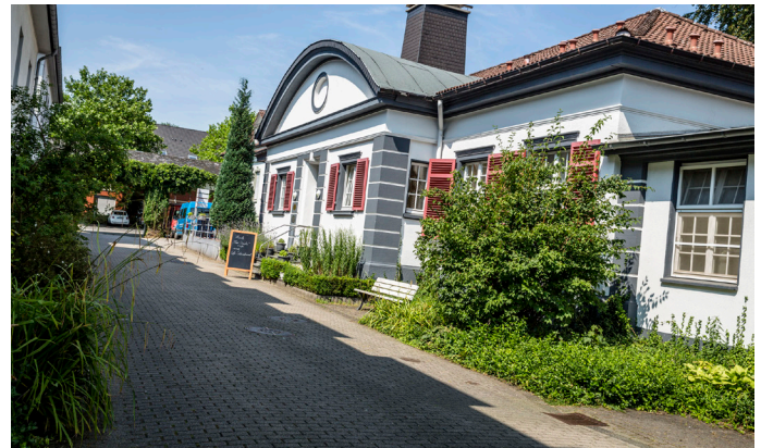
Die Cafeteria im Friedensheim ist immer wieder Treffpunkt für verschiedenste Veranstaltungen.